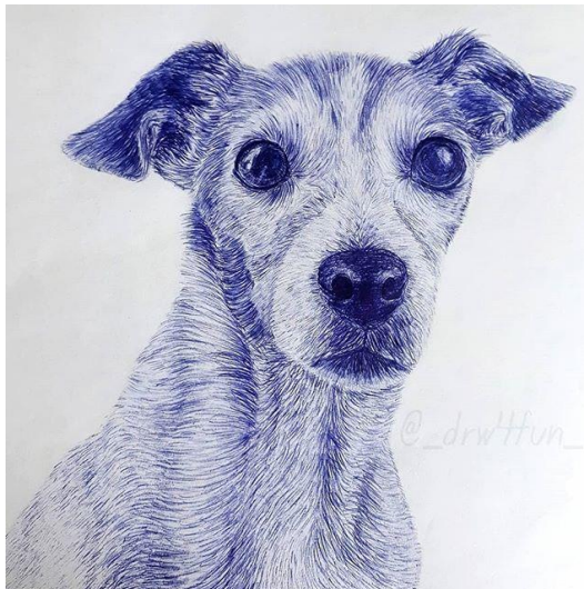
Beispiel 6 (von 2018)