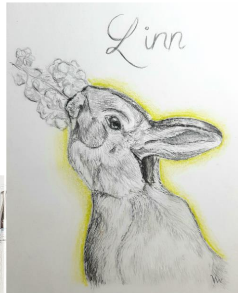
Beispiel 8 (von 2018)