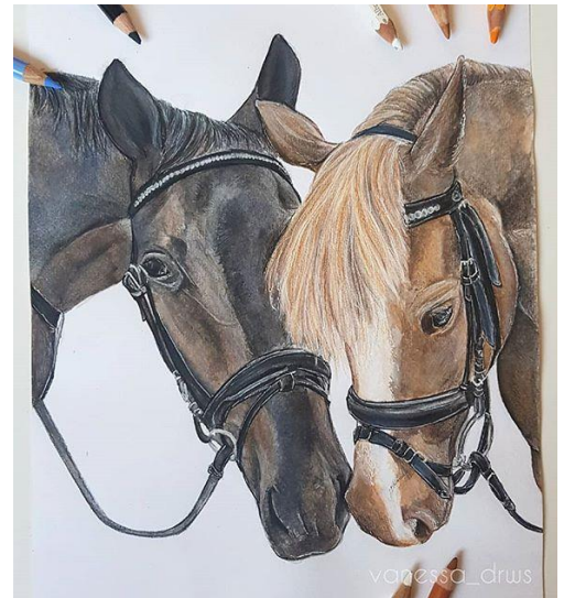
Beispiel 1 (von 2019)

Gegen eine Spende von 20€ (oder für die Tiere gerne auch mehr), von denen 10€ an das Tierheim Alsfeld gehen werden, könnt ihr euch nun eure personalisierten Karten sichern.