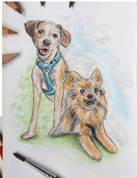
Beispiel 7 (von 2019)